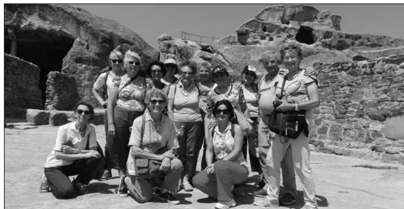
Georgia - Gori città rupestre.