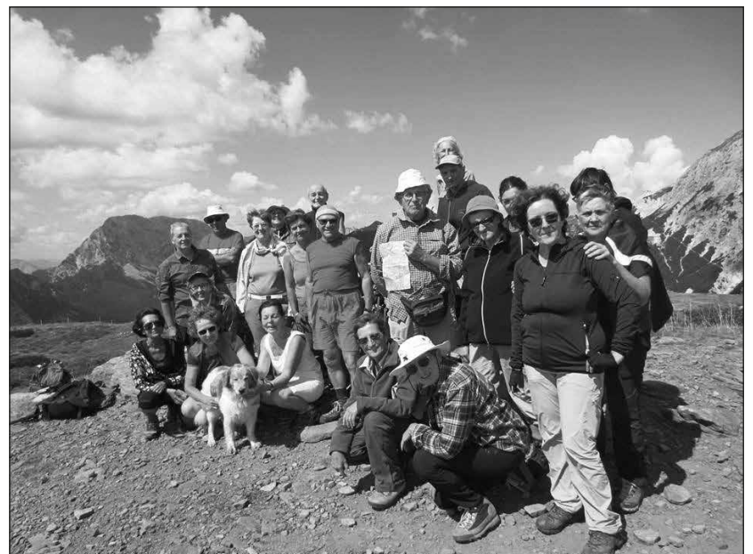
19 agosto 2018 - Monte Corona m 1832.