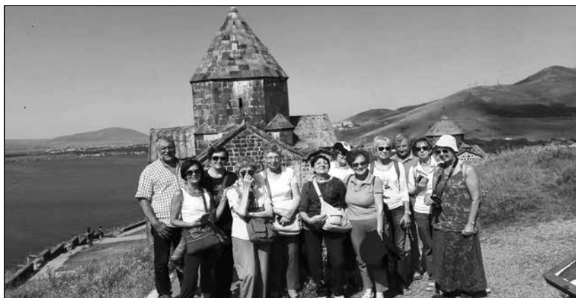
Armenia - Il monastero di Sevanavank.