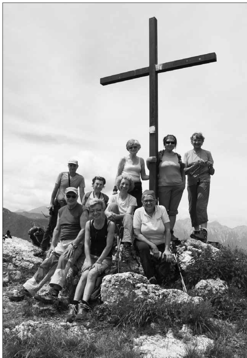
In cima al monte Fara 3 giugno 2018.