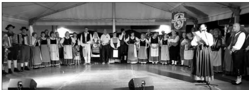
Stelutis a Bovec.