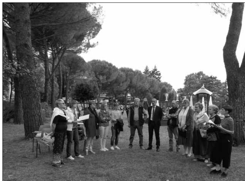
Il Grop Coral Gjviano a Una mattina al parco.

della Civica Accademia d'Arte Drammatica Nico Pepe