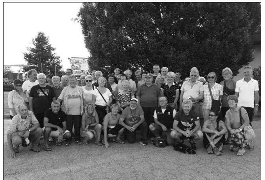
Gita sociale a Recoaro Terme del GMU domenica 8 luglio 2018.