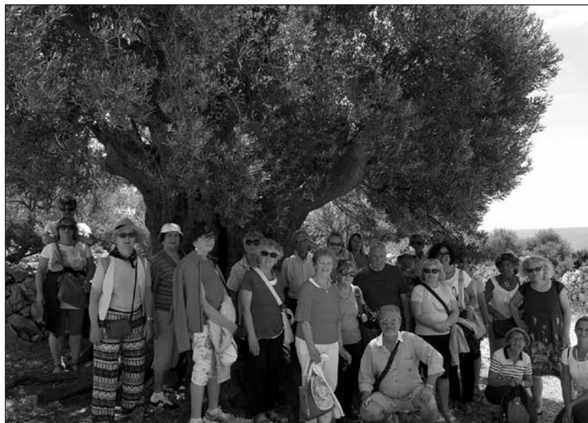
Nell'isola di Pag sotto un ulivo millenario.